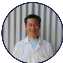
Freek Productie / afwerking