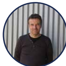
Erik Productie / afwerking