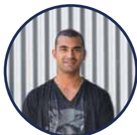
Jerino Productie / Afwerking